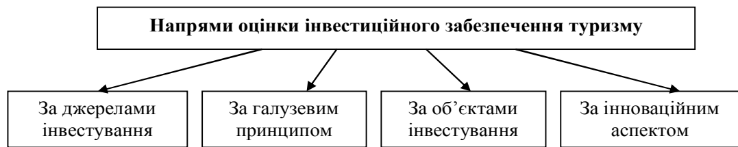
Рис. 1. Напрями оцінки інвестиційного забезпечення

Оцінка інвестиційного забезпечення за джерелами інвестування. До джерел інвестиційного забезпечення розвитку туристичної галузі слід відносити: вкладення в туристичні підприємства іноземного та вітчизняного капіталу, кредитні фінансові ресурси, внутрішні інвестиційні джерела підприємств (амортизація, прибуток), заощадження населення (напрямую та через фінансові установи).