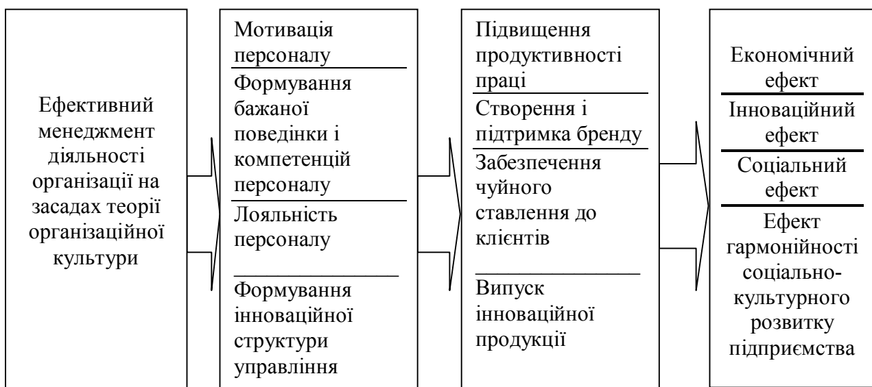
Рис. 2. Результат ефективного менеджменту діяльності організації на засадах теорії організаційної культури

Використання організаційної культури як дієвого управлінського інструменту передбачає розробку методик для оцінки рівня розвитку, особливостей, вимірювання впливу культури на забезпечення довгострокової ефективності підприємства. Проте у більшості сучасних досліджень основний акцент робиться на виявленні і детальній характеристиці особливостей організаційної культури конкретного підприємства без встановлення причинно-наслідкового зв'язку із економічною ефективністю.