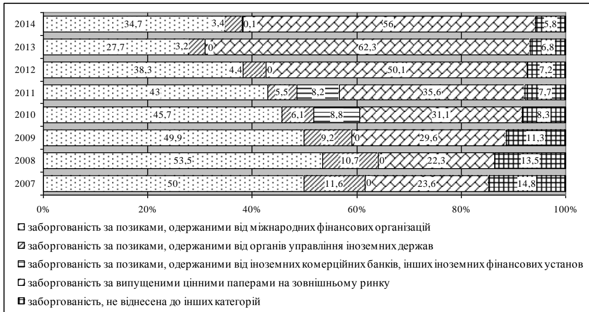
Рис. 3. Зовнішня заборгованість України за видами позик у 2007-2014 роках Примітка: Складено за даними Національного Банку України

2007 роком. Максимальне значення даного показника спостерігалось у 2008 році – 53,3%, а мінімальне у 2013 році – 27,7%. Проте, стрімко зростає питома вага заборгованості за випущеними цінними паперами на зовнішньому ринку – з 23,6% у 2007 році до 62,3% у 2013 році, і лише у 2014 році вона зменшується на 6,3% в порівнянні з попереднім роком. Протягом восьми років суттєво скорочується частка заборгованості за позиками, одержаними від органів управління іноземних держав (на 8,2%) та заборгованості, не віднесеної до інших категорій (на 9%).