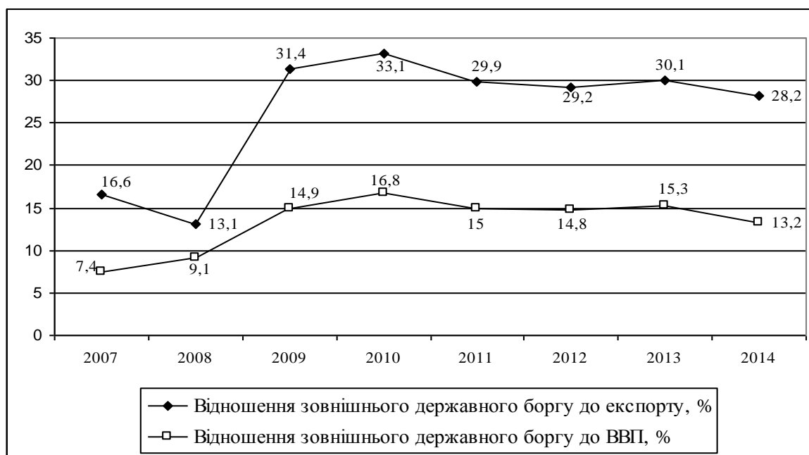
Рис. 2. Відношення зовнішнього державного боргу до ВВП та експорту товарів і послуг у 2007-2014 роках

зовнішнього боргу до ВВП інтенсивно зростає з 7,4% до 16,8% відповідно (рис. 2). Це пояснюється посиленням співпраці України з міжнародними фінансовими організаціями у сфері кредитування. Впродовж наступних років рівень відношення зовнішнього боргу до валового внутрішнього продукту зменшився, проте залишався досить високим для посилення боргової стійкості держави. Водночас, відношення зовнішнього боргу до експорту товарів і послуг було низьким лише у 2007-2008 роках – 16,6% та 13,1% відповідно, проте високі значення даного показника у 2009-2014 роках (близько 30%) вказують на значну неплатоспроможність України. При цьому, структура експорту України із високою питомою вагою сировинної складової створює ризики девальвації національної валюти в процесі стимулювання розвитку окремих галузей. Економіка такого типу є чутливою до змін на світовому ринку, негативні тенденції зміни цін приводять до зменшення експорту та створюють додатковий тиск на курс гривні.