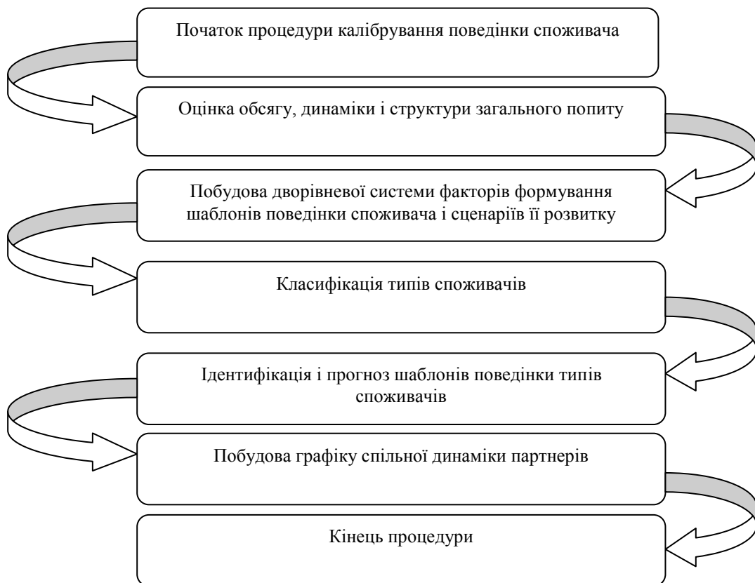
Рис. 3 Процес калібрування поведінки споживача

Під час створення структурно-логічної моделі удосконалення стратегічного управління, виходили з припущення, що у загальній динаміці середовища існують корельовані і незалежні цикли та нециклічні тренди. Для детального аналізу впливів чинників із зовнішнього оточення використовується процес калібрування поведінки споживача (рис. 3).