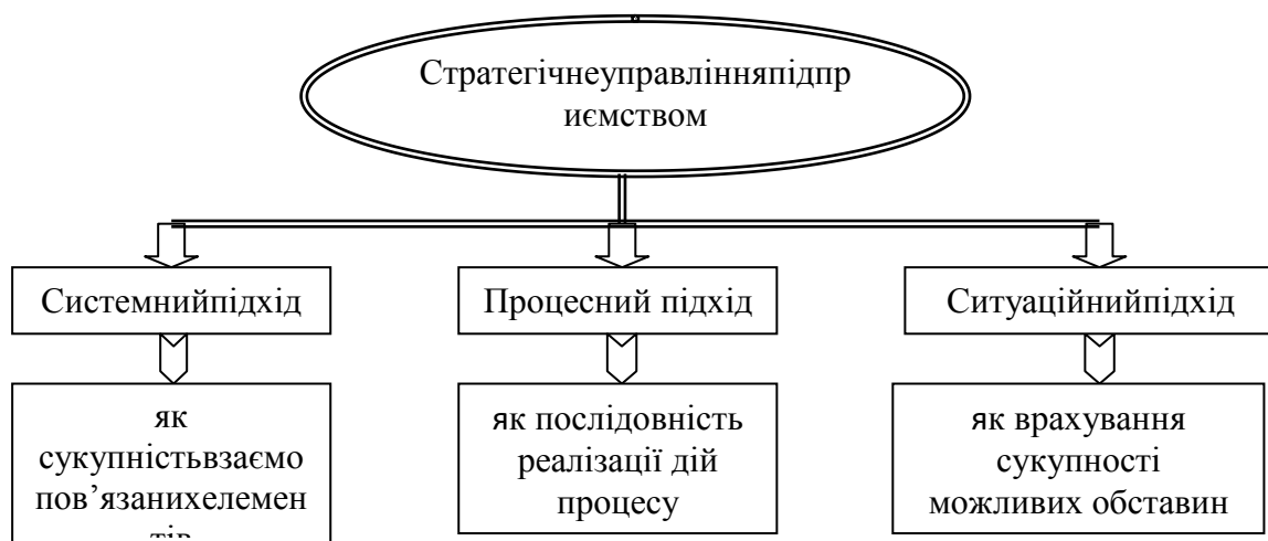
Рис. 1. Основні підходи до визначення стратегічного управління підприємством

Враховуючи те, що стратегічне управління підприємством має певну сукупність взаємопов'язаних між собою елементів, реалізація яких вимагає послідовного процесу, в статті пропонується розглянути дану категорію, виходячи із системного, процесного та ситуаційного підходів (рис. 1).