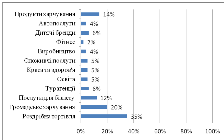
Рис. 3 Структура франчайзингу в Україні (сформовано автором на основі [6; 8; 9; 10; 11])

У 2015 року більшість вітчизняних франшиз працюють у галузі роздрібної торгівлі (423 франшизи), ресторанного господарства (210 франшиз), послуг для бізнесу (151 франшиза), сфера краси та здоров'я (75 франшиз), дитячих брендів (71 франшиза) (рис. 3) [6; 8]. Окрім наведених галузей, у перспективі розглядається розвиток таких галузей як сільське господарство, операції з нерухомістю, дизайн та архітектура, дистрибуція, юридичні послуги тощо [9].