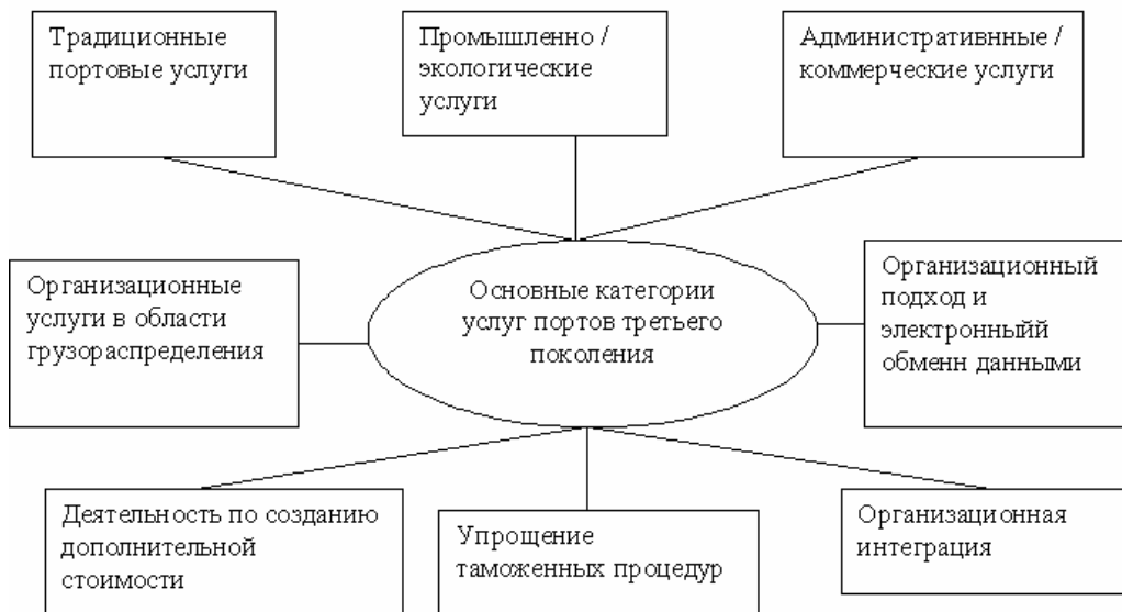
Рис. 3. Деятельность и услуги портов третьего поколения

Порты третьего поколения появились в 80-х годах благодаря интенсивному развитию контейнеризации и широкому распространению мультимодальных перевозок (рис. 3). Кроме того, этому способствовало развитие логистического подхода в управлении и оптимизации цепей поставок (в которые активным образом включались порты). Однако это совсем не значит, что деятельность портов первого и второго поколения подошла к концу.