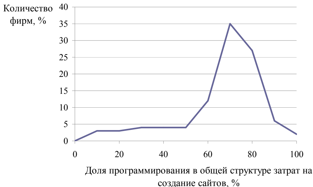
Рис. 2. Затраты на заработную плату программистов в общей стоимости проекта

Зарботная плата квалифицированного веб-дизайнера в странах, где созданы самые дорогие сайты мира, – 150–200 тыс. долларов в год. Средняя годовая зарплата веб-дизайнера в развитых странах составляет 60–120 тыс. долларов. Профессиональный уровень украинских программистов и веб-дизайнеров ничем не уступает иностранным, кроме зарплаты.