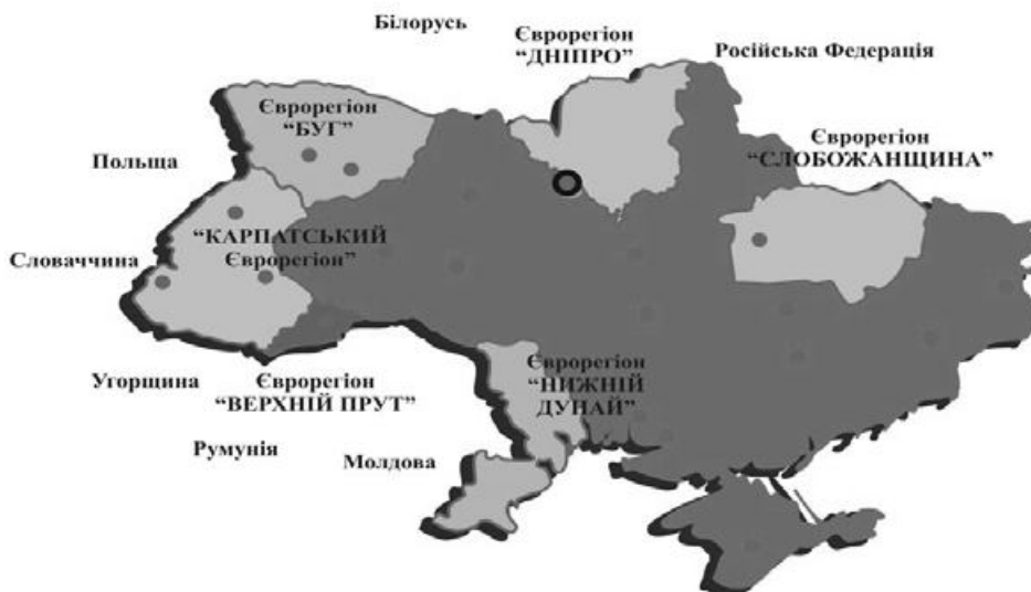
Рис. 1. Розміщення євро регіонів по території України [6]

В даний час шість областей України входять до складу чотирьох євро регіонів – це Львівська, Закарпатська, Івано-Франківська, Чернівецька (у складі Карпатського євро регіону, заснованого у лютому 1993 року), Волинська (у євро регіоні «Буг», заснованому у вересні 1995 року). Одеська (у євро регіоні «Нижній Дунай», заснованому у вересні 1998 року) та «Верхній Прут» за участю Чернівецької області і повітів Румунії і Молдавії (рис. 1). У 2003 р. створено євро регіон «Дніпро», до якого увійшла Чернігівська область разом з регіонами Російської Федерації та Республіки Білорусь.