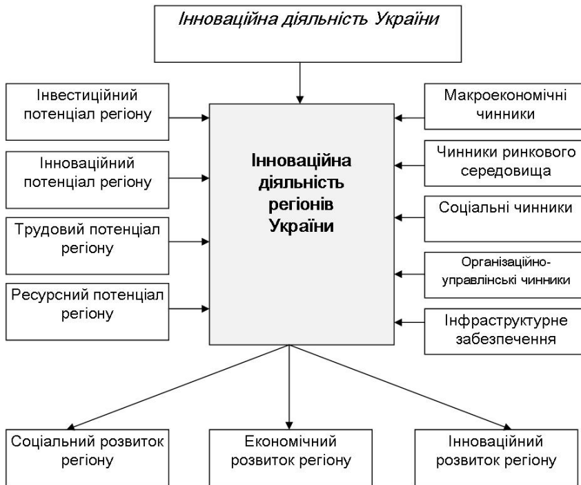
Рис. 2. Модель перспективного розвитку інноваційної діяльності регіонів