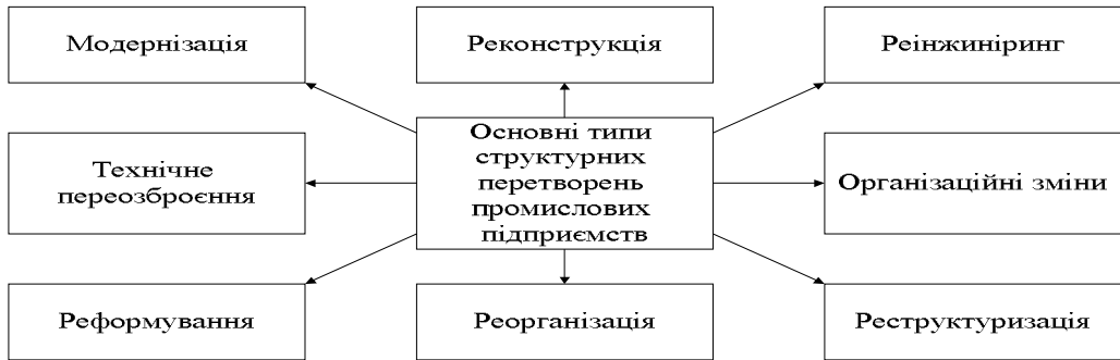
Рис. 2. Основні типи структурних перетворень на промислових підприємствах

Під організаційними змінами розуміється будь-яка зміна в одному або кількох елементах підприємства (рівня спеціалізації, діапазону контролю, розподілу повноважень, механізмів координації тощо) на будь-якій стадії життєвого циклу організації, що може проявлятися в перетворенні потенціалу підприємства та в зміні розмірів, масштабів та цілей діяльності [3].