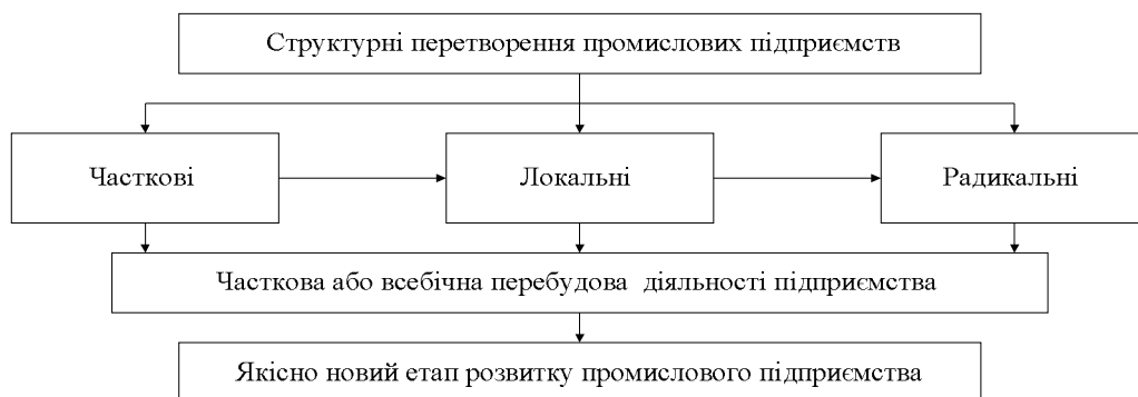
Рис. 1. Взаємозв'язок структурних перетворень на підприємстві та їх результатів

Так, часткові структурні перетворення направлено на окремі зміни в будь-яких сферах діяльності підприємства (зміна пріоритетів, технології, структурні зміни тощо). Локальні структурні перетворення, в свою чергу, відбуваються лише у певній сфері діяльності підприємства (зміна бізнес-процесів, маркетингової політики тощо). При цьому, локальні структурні перетворення направлено на зміну діяльності підприємства лише у випадку, коли підприємство виходить із новим товаром (або послугою) на ринок, не змінюючи при цьому сфери своєї діяльності. [4]. Радикальні структурні перетворення направлено на більш швидку фундаментальну перебудову в системі управління, структурі підприємства та бізнес-процесах, та обумовлено кардинальною зміною умов функціонування або обраної стратегії. Взаємозв'язок структурних перетворень на підприємстві та їх результатів наведено на рис. 1.