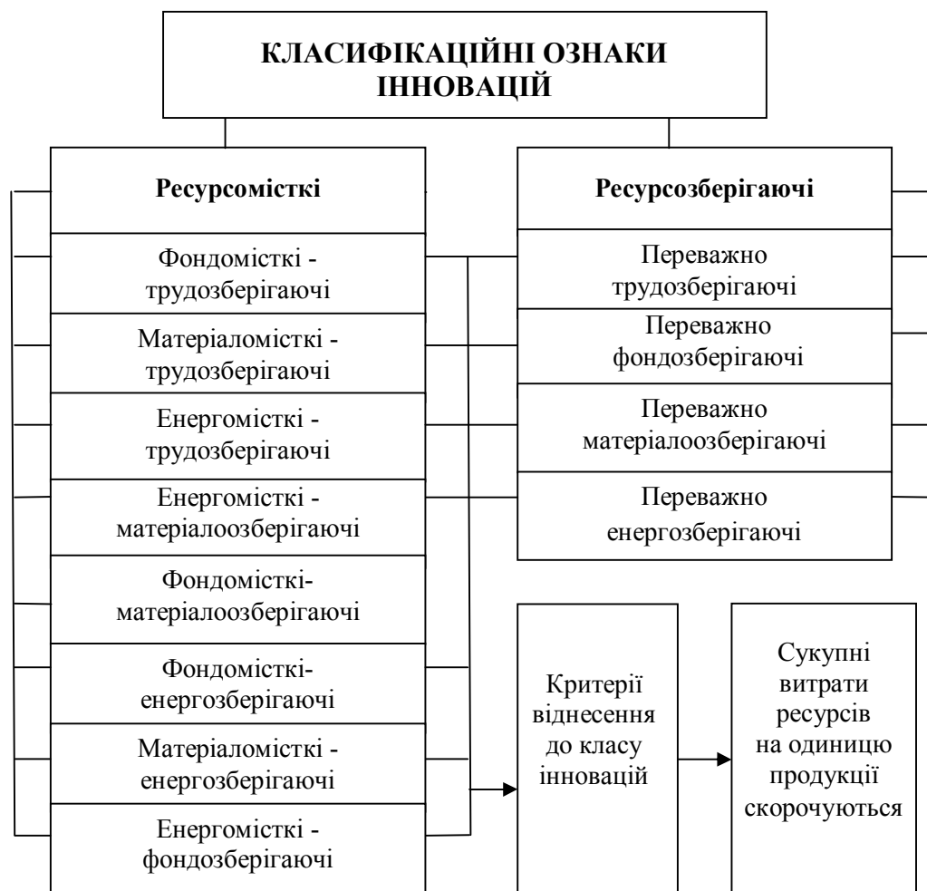
Рис. 2. Класифікація інновацій за критерієм інтенсифікації виробництва [7]

вок, що між новацією та інновацією існує різниця, що полягає в тому, що новація стає інновацією лише тоді, коли використання новації сприяє зниженню витрат ресурсів на одиницю продукції, що надалі на певному етапі її життєвого циклу призведе до отримання економічного, соціального або іншого ефектів.