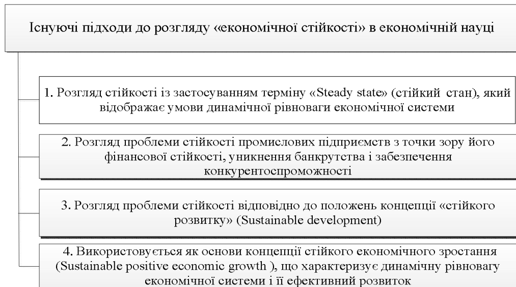
Рис. 1. Існуючі підходи до розгляду «економічної стійкості» функціонування та розвитку підприємства

трудових ресурсів підприємства, їх розподіл і використання, які забезпечують розвиток підприємства на основі зростання прибутку і капіталу при збереженні платоспроможності та кредитоспроможності в умовах допустимого рівня ризиків.