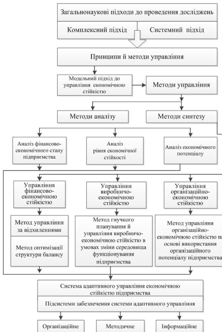
Рис. 4. Концепція управління економічною стійкістю підприємства

Концепція управління економічною стійкістю підприємства наведено на рис. 4.