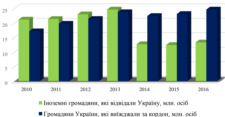
Рисунок 1 – Кількість відвідувань України іноземними туристами та виїздів громадян України за кордон

За даними Державної служби статистики України, у 2016 році до України в'їхали 13,3 млн туристів, що на 46% менше, ніж у 2013 році. Водночас кількість громадян України, що подорожують за кордон, протягом багатьох років має стійку тенденцію до зростання. Так, протягом 2016 року здійснили подорожі за кордон 24,7 млн українських туристів, що на 44% більше, ніж у 2010 році (рис. 1) [6].