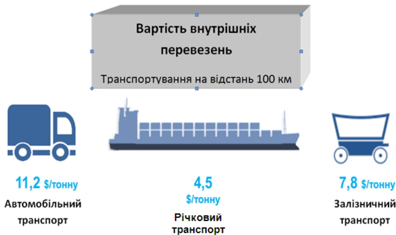
Рисунок 2 – Порівняльна характеристика витрат на перевезення вантажів різними видами транспорту

Зрозуміло, що сфера застосування на транспортуванні зерна кожним видом транспорту має свою специфіку. Об'єктивно при цьому бажаним є використання логістичного підходу до вибору раціонального способу доставки вантажів аграрного сектору. Детальний аналіз цього питання не є предметом розгляду в цій статті. Але витрати на перевезення зерна автомобільним та комбінованим транспортом відіграють чи не найсуттєвіше значення, що видно на рисунку 2.