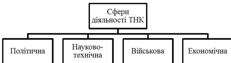
Рис. 1. Сфери діяльності транснаціональних корпорацій

Політична сфера діяльності ТНК характеризується тим, що, виходячи на міжнародні ринки, ТНК активно взаємодіють з керівниками місцевих та центральних органів влади. Крім цього, встановлюються певні контакти з представниками провідних політичних партій з метою лобіювання своїх комерційних інтересів.