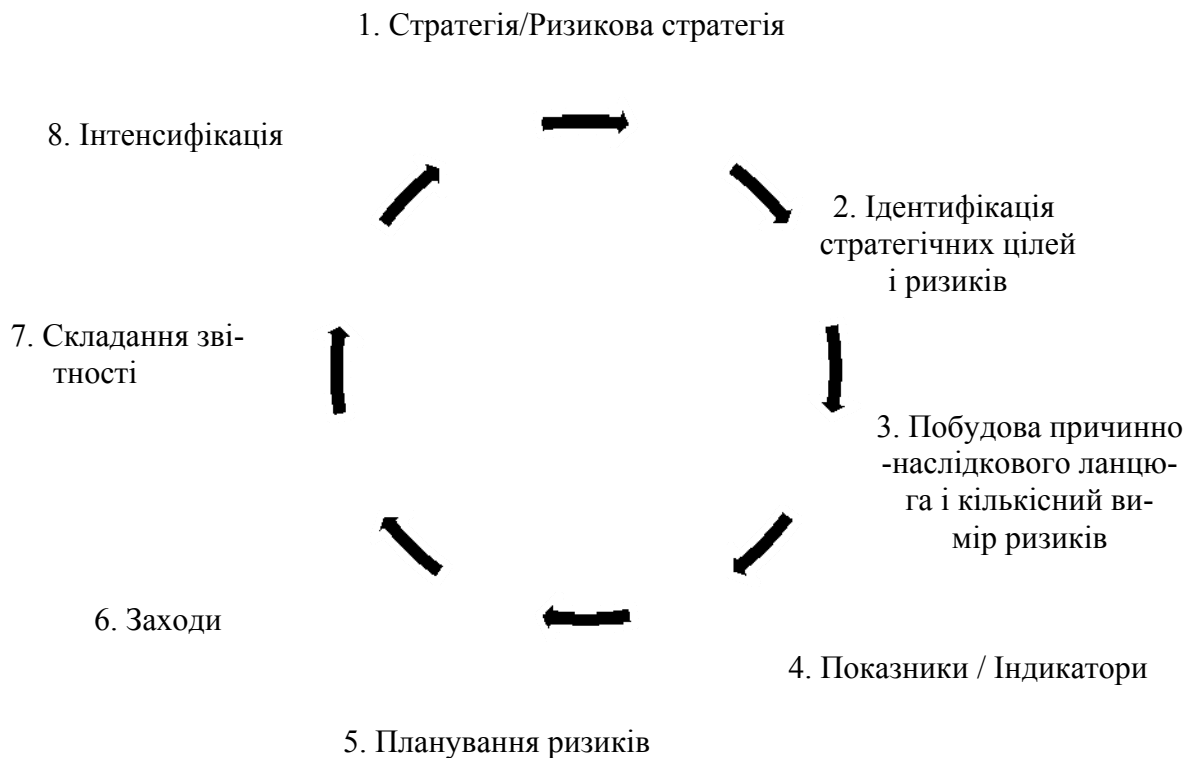
Рис. 2. Етапи процесу стратегічного керування й керування ризиками

У системі керування ризиком, як показано на рис. 2, процес починається з аналізу стратегії підприємства. На першому етапі варто дати відповідь на принципове питання про ступінь ризикованості оточення, у якому працює компанія. Конкретна стратегія керування ризиками виробляється пізніше, оскільки спочатку керівництво компанії повинне одержати результати проведеного аналізу ризиків. Базова стратегічна орієнтація компанії також повинна враховувати ризики, які виявлені на етапі стратегічного аналізу.