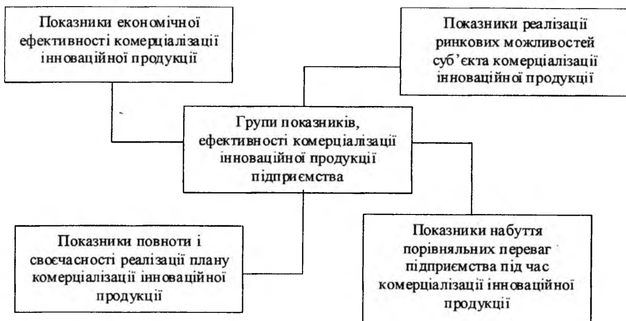
Рис. 1. Групи показників, за якими доцільно оцінювати ефективність комерціалізації інноваційної продукції підприємства

3) обсяг прибутку підприємства від реалізації інноваційної продукції (Прибуток підприємства від реалізації інноваційної продукції обчислюється як різниця між валовим доходом підприємства, отриманим від реалізації інноваційної продукції, що скоригований на обсяг податку на додану вартість та витратами на комерціалізацію інноваційної продукції. Це один з ключових показників, на основі якого приймається рішення про ефективність комерціалізації інноваційної продукції. Його значення використовується для техніко-економічного обґрунтування проектів комерціалізації інноваційної продукції, підготовки бізнес-планів тощо);