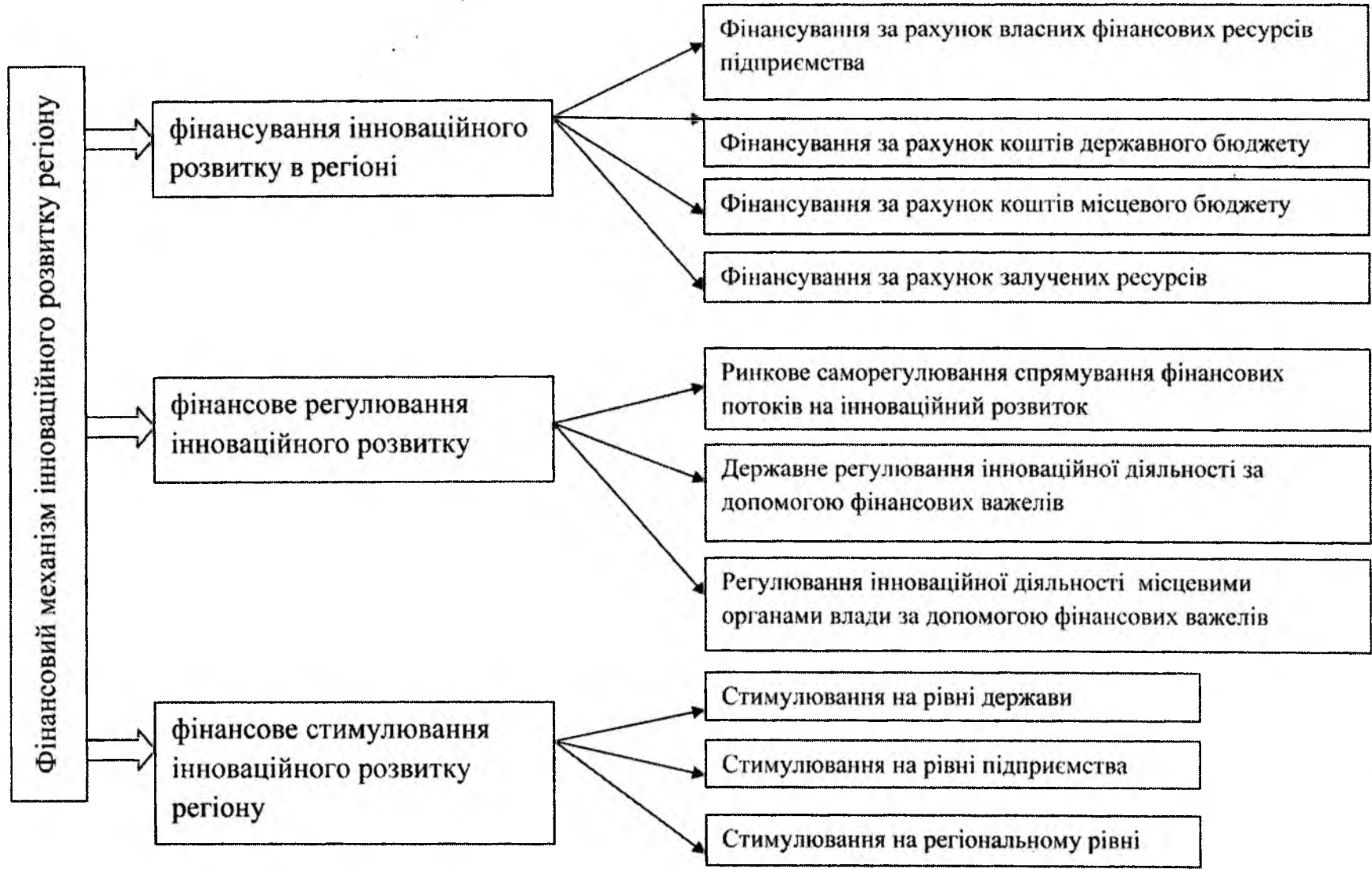
Рис.2. Структура фінансового механізму інноваційного розвитку регіону