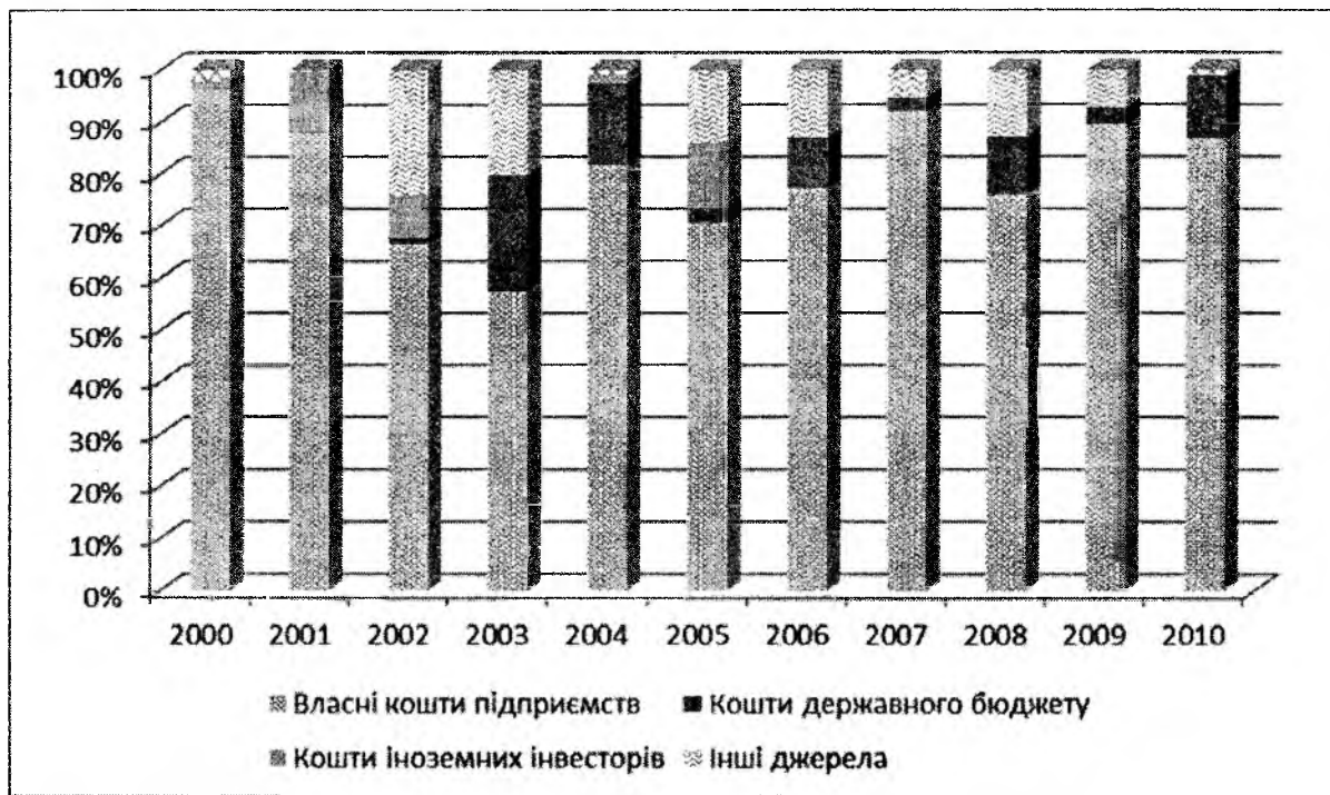
Рис. 4. Розподіл джерел фінансування інноваційної діяльності в Дніпропетровській області з 2000 по 2010 роки

Також слід відмітити, що дієвий фінансовий механізм не можливий без фінансового регулювання та стимулювання інноваційного розвитку регіону. Універсальними інструментами регулювання інноваційного розвитку слід вважати податки, відрахування, дотації та субсидії [5]. Найбільш поширеним фінансовими стимулами вважаються пільгове кредитування, податкові пільги, виплата компенсацій. До методів державної підтримки розвитку інновацій відносять дотаційне фінансування, створення сприятливого інноваційного клімату, податкові та кредитні пільги, страхування інноваційних ризиків [6].