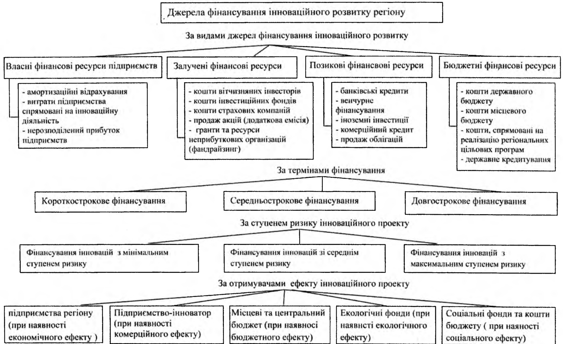
Рис 5. Класифікація джерел фінансування інноваційного розвитку регіону