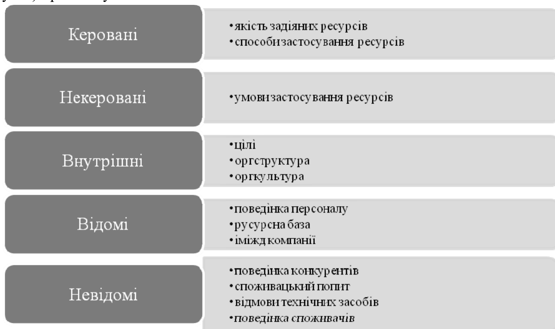
Рис. 1. Групи факторів, що впливають на ефективність діяльності підприємств туристичного комплексу

Гіпотеза дослідження полягає в припущенні наявності комплексу чинників, що визначають ефективність діяльності підприємств туристичного комплексу. Виявлення таких чинників і встановлення домінуючого фактору дозволяє визначити конкретні напрями підвищення ефективності діяльності даного комплексу з урахуванням природи та специфіки економічних відносин підприємств туристичного комплексу.