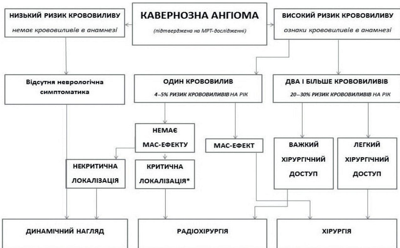
Рис. 2. Алгоритм лікування КА

*зони критичної локалізації: підкіркові ядра, таламус, середній мозок, міст, стовбур мозку