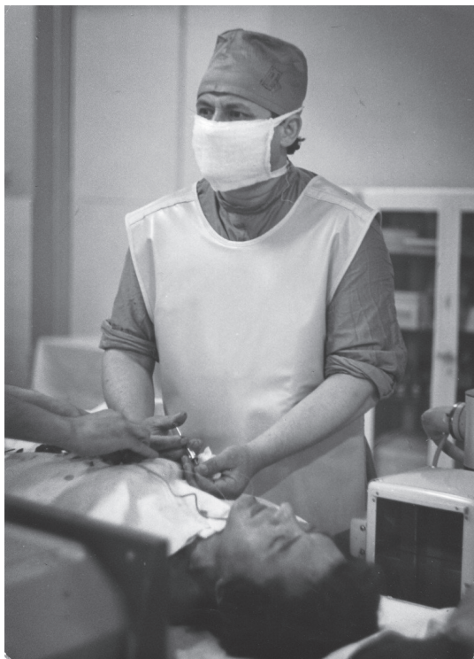
Одна з перших операцій, 1975 р.