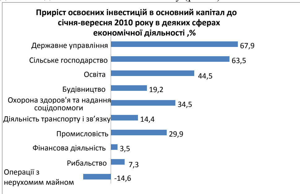
Рис. 7. Приріст освоєних інвестицій в основний капітал[5] .

Зменшення інвестицій в основний капітал спостерігалось у операціях з нерухомим майном, оренда, інжиніринг та надання послуг підприємцям - на 14,3 відсотка порівняно з відповідним періодом попереднього року і становили 15,7 відсотка від їхнього загального обсягу (рис. 7).