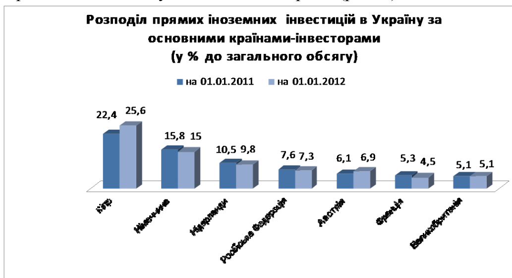
Рис. 3. Розподіл прямих іноземних інвестицій в Україну [5] .

До десятки основних країн-інвесторів, на які припадає майже 83% загального обсягу прямих інвестицій, входять: Кіпр, Німеччина, Нідерланди, Російська Федерація, Австрія, Велика Британія, Франція, Швеція, Віргінські Острови, Британські та Сполучені Штати Америки (рис. 3).