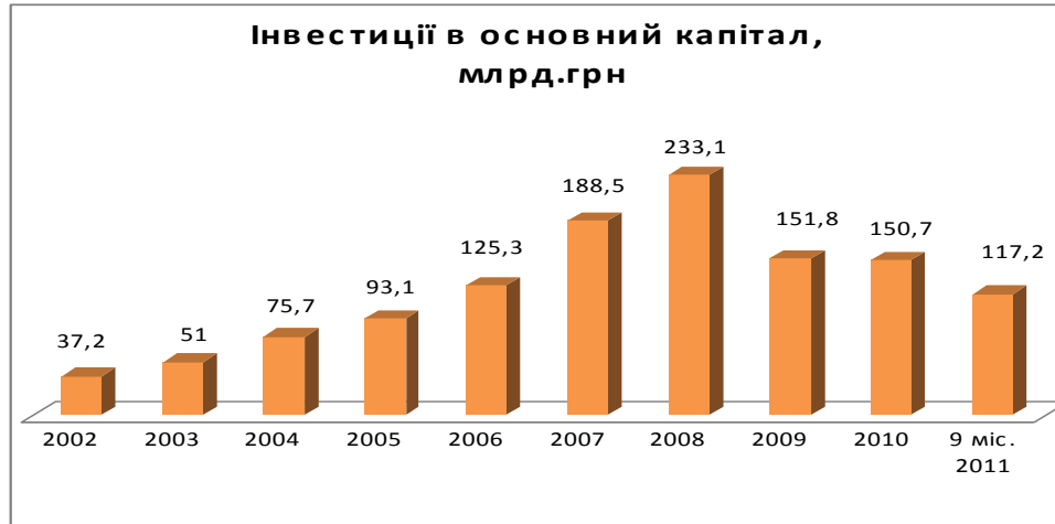
Рис. 5. Інвестиції в основний капітал [5]

Аналіз динаміки освоєних інвестицій в основний капітал у 2009-2011 роках також свідчить про спад темпів їх зростання, що свідчить про можливість виникнення ризиків щодо незавершеного виконання та недофінансування інвестиційних проектів у перспективі, збільшення обсягів зносу основних фондів та зниження конкурентоспроможності продукції.