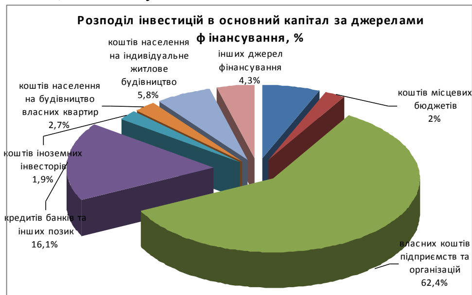
Рис. 8. Розподіл інвестицій в основний капітал за джерелами[5] .

За рахунок державного та місцевих бюджетів освоєно 8,7 відсотка інвестицій в основний капітал. Частка коштів населення на будівництво власного житла становила 8,6 відсотка усіх капіталовкладень.