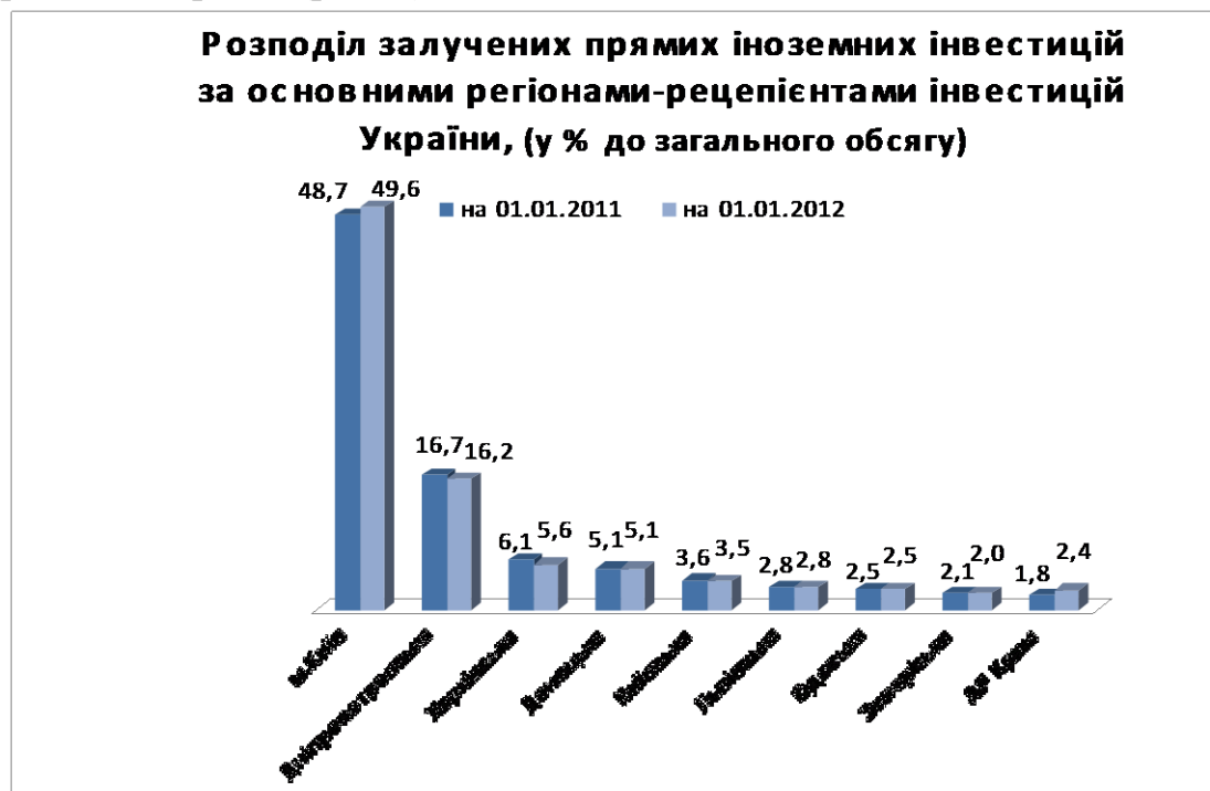
Рис. 4 . Розподіл залучених прямих іноземних інвестицій в Україну [5].

Спостерігається непропорційний розподіл обсягів залучення інвестицій у регіони України (рис. 4).