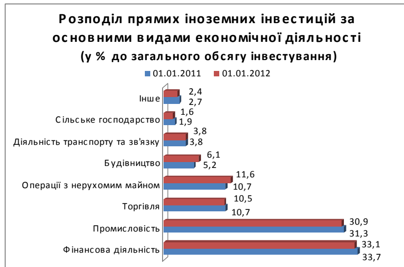
Рис. 2 . Розподіл прямих іноземних інвестицій [5]

На підприємствах промисловості зосереджено 30,9 % загального обсягу прямих інвестицій в Україну, у фінансових установах – 33,1% (рис. 2).