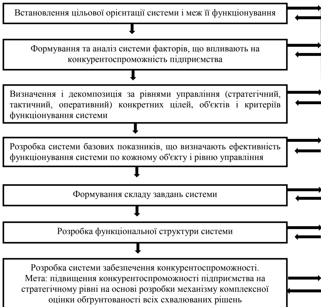
Рис.1. Етапи формування механізму управління конкурентоспроможністю * розроблено автором