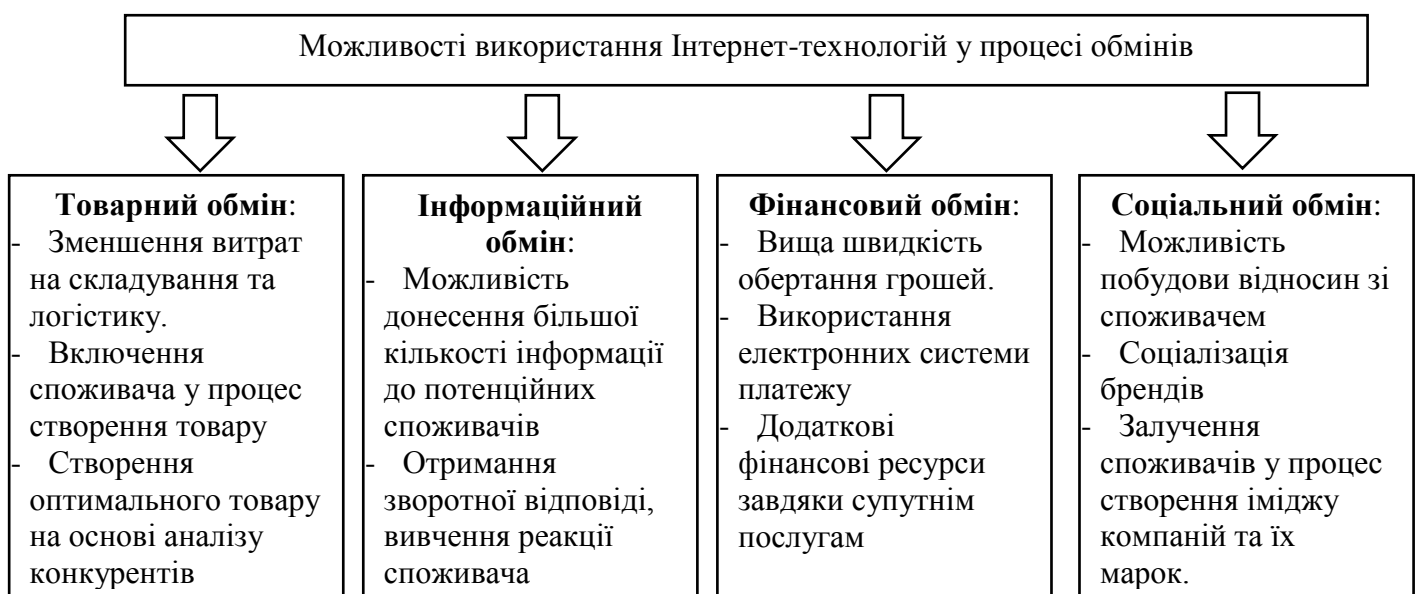
Рис.3. Можливості використання Інтернет-технологій у процесі обмінів

Використання Інтернет-технології в маркетинговій діяльності підприємства дає можливість підвищити ефективність кожного з виділених обмінів(рис.3.).