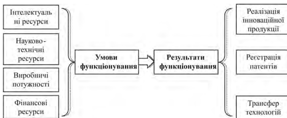
Рис. 2. Схема «умови-результати» функціонування інноваційних систем підприємств машинобудування

Для більш детального аналізу доцільним вважається запропонувати таку схему визначення стану інноваційних систем підприємств машинобудування (рис.2).