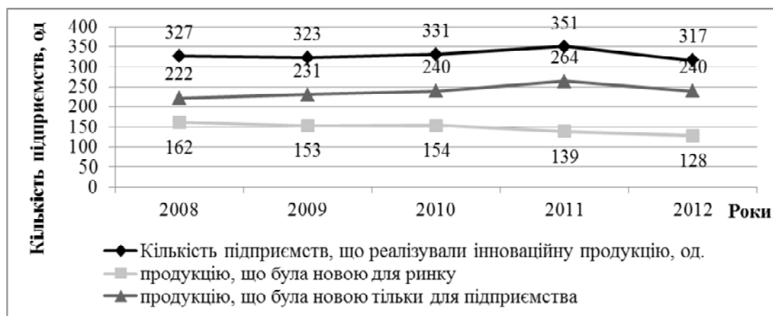
Рис. 4. Реалізація інноваційної продукції підприємствами машинобудування

Реалізація інноваційної продукції. Визначивши кількість підприємств, що виробляють інноваційну продукцію, необхідно знати які з них змогли її реалізувати (рис. 4).