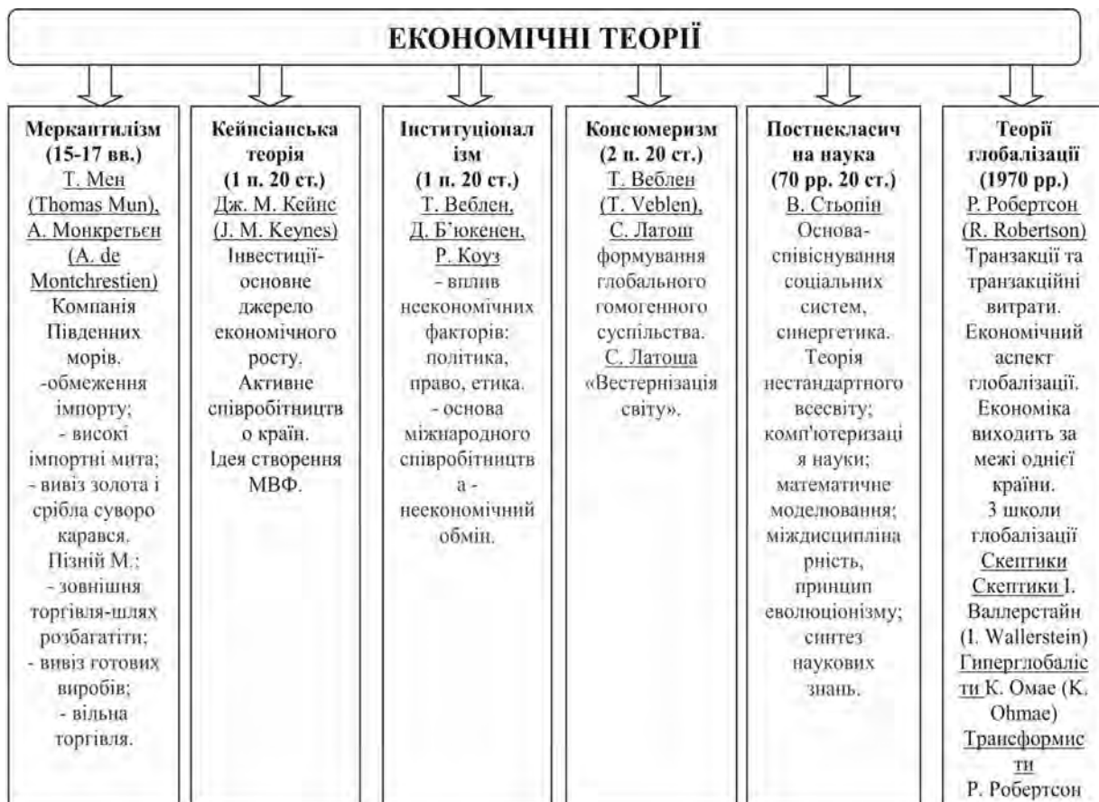
Рис.1. Класичні економічні теорії в контексті теорій глобалізації та транснаціоналізації

Дж. М. Кейнс ( J. M. Keynes ) ( кейнсіанська теорія ) вважав інвестиції основним джерелом економічного зростання. Був прихильником активної взаємодії і співпраці країн. Саме Кейнсу належить ідея створення МВФ. Прихильники інституціоналізму (Т. Веблен ( T. Veblen ), Д. Б'юкенен ( J. Buchanan ), Р. Коуз ( R. Coase )) більший акцент робили на вплив неекономічних чинників, таких як політика, право, етика. Міжнародне співробітництво між країнами ґрунтувалося на неекономічному обміні. Вперше розглянули трансакції (договори) і трансакційні витрати, які несли різні інститути. Взагалі, інституціоналізм вважається економіко-еволюційною системою, яка дала поштовх глобальним трансформаціям.