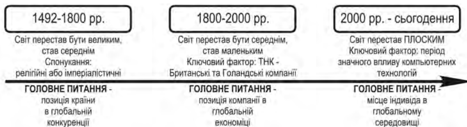
Рис. 2. Три епохи глобалізації [1]

Таким чином, сучасне теоретико-методологічне забезпечення щодо дослідження процесу впливу глобалізації на транснаціоналізацію на мега- та мета рівнях, аналізуючи ці процеси з позиції головних факторів виробництва: труда, землі, капіталу та інформації, не відповідає на всі питання сучасності. Тому є наявною трансформація самого процесу глобалізації та її стохастичність. Данні питання в сучасних умовах знайшли відображення в роботах Т. Фридмана ( T. Friedman ). Відомі три великі епохи глобалізації.