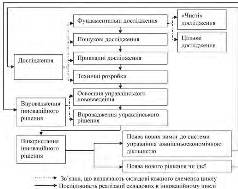
Рис. 1. Структурно-логічна схема інноваційного циклу в розрізі зовнішньоекономічної діяльності підприємства Джерело: розроблено авторами на основі [5]

Щодо інноваційного потенціалу системи управління то автори [1] визначають його як узагальнені характеристики можливостей системи управління до впровадження інноваційного процесу, що визначається структурою та змістом елементів системи управління, їх невикористаними та прихованими можливостями, які використовуються з метою досягнення поставлених цілей. Тобто, автори визначають дане поняття через сукупність певних складових елементів, що його характеризують. Але, в сучасній літературі немає одностайності щодо структури потенціалу інноваційного розвитку системи управління.