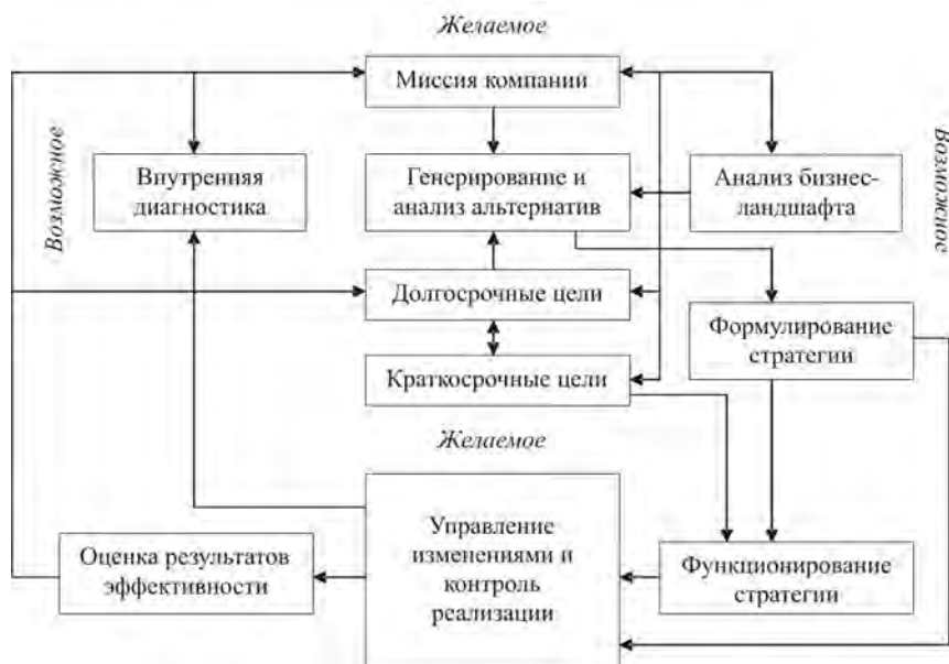
Рис. 1. Общая модель стратегического процесса [12]