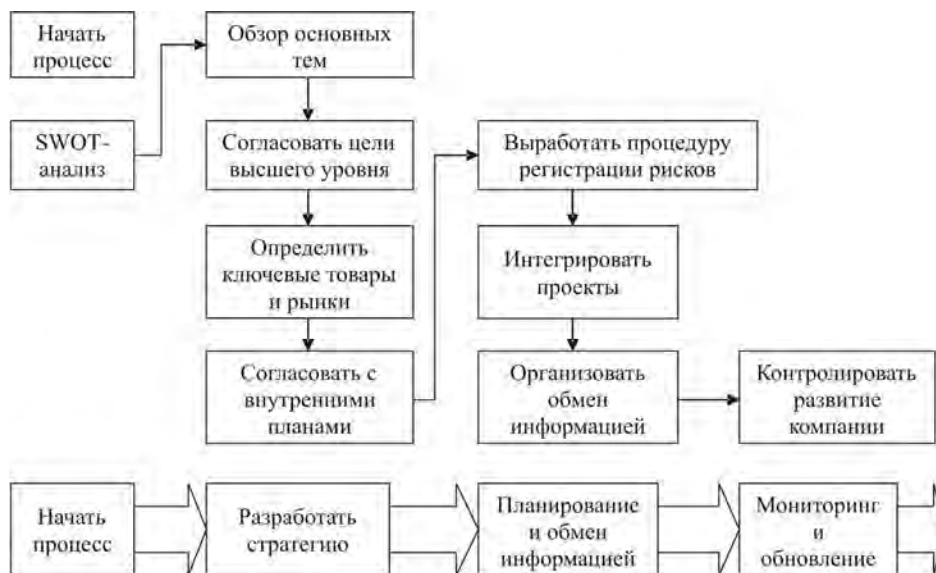
Рис. 2. Модель процесса разработки стратегии предприятия [6]

8. Integrate all wide-projects... Интегрировать на уровне концептуального понимания все корпоративные проекты и ключевые направления деятельности.