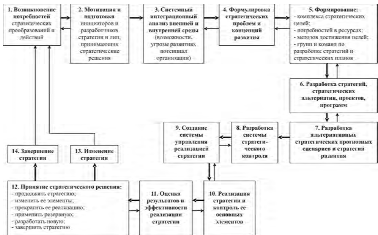
Рис. 4. Системная модель процесса эффективного стратегического менеджмента производственного предприятия [7]