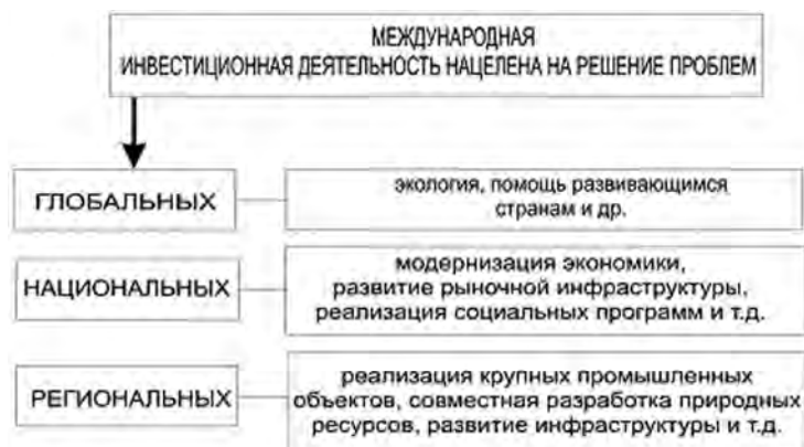
Рис. 1. Целевая компонента международной инвестиционной деятельности

трудовых и интеллектуальных ресурсов с целью обновления технологической структуры производства. Международная инвестиционная деятельность как в предпринимательской (прямые или портфельные инвестиции), так и в ссудной (инвестиционные займы и кредиты, безвозмездная помощь) форме нацелена на решение проблем различного уровня.