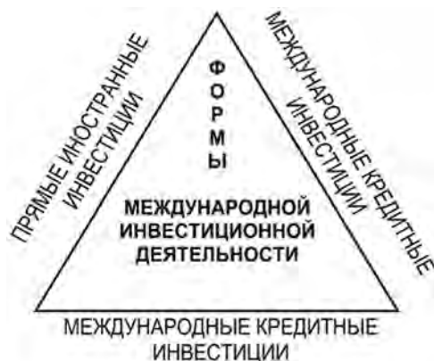
Рис. 2. Видовая характеристика международной инвестиционной деятельности

Объектами международного инвестирования выступают инвестиционные активы. По материально-вещественному признаку они объединяются в две группы: финансовые активы, к которым относятся ценные бумаги и инвестиционные товары, которые могут быть подразделены на материальные и нематериальные активы.