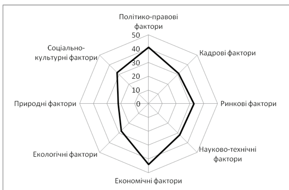
Рис. 3. Узагальнена графічна модель рівня негативного впливу складових економічної безпеки підприємств будівельних матеріалів, %

Найсуттєвим є негативний вплив на економічну безпеку підприємств будівельних матеріалів економічних факторів, таких як економічна нестабільність, умови кредитування, інфляційний фактор. Ці фактори, при несприятливому перебігу подій здатні призвести до втрати близько 40% економічної безпеки підприємства. Це обумовлено тим, що дана група факторів чинить вагомий вплив практично на всі складові економічної безпеки підприємств будівельних матеріалів. На другому місці за ступенем впливу знаходяться політико-правові фактори, такі як нестабільність законодавства, зміни в податковій сфері, політична нестабільність, неефективність системи державного регулювання, високий рівень корупції тощо. Ці фактори можуть обумовити до 30% втрати загальної безпеки. Приблизно однаковим є вплив інших складових, окрім природних, вплив яких на економічну безпеку підприємств визнаний експертами як найнижчий. Однак навіть цей вплив є досить значимим і складає близько 15% загального рівня економічної безпеки.