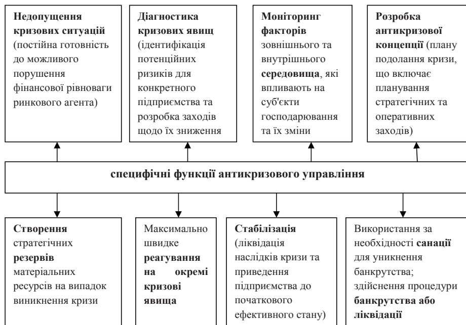
Рис. 2. Специфічні функції антикризового управління (уточнено автором на основі [1;13;23 ])

Виконання цих функцій має специфічну спрямованість, яка полягає у своєчасній ідентифікації кризових явищ, що існують зовні та всередині підприємства, розробці та впровадженні заходів щодо запобігання, ліквідації або пом'якшення впливу негативних факторів на діяльність підприємства, прискореній та дієвій реакції на зміни в зовнішньому оточенні, розробці та введенні в дію інструментів в рамках складових елементів господарського механізму, які у критичній ситуації (наприклад, на межі банкрутства) могли б забезпечити вихід підприємства з такого стану з найменшими втратами.