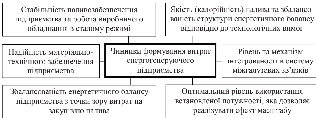
Рис. 1. Чинники формування витрат енергогенеруючого підприємства (розроблено автором)

Серед наведених чинників особливу увагу слід звернути на рівень та механізми інтегрованості підприємства в систему міжгалузевих зв'язків. Мова йде про те, що у сфері ПЕК можна досягати зменшення витрат через формування різного роду інтегрованих утворень, зокрема вертикально-інтегрованих енерговугільних компаній [1,3]. Інтеграція підприємств відкриває нові можливості для вирішення вищеописаних проблем, і що найважливіше, – для реалізації потенціалу синергетичного ефекту. З огляду на специфіку середовища діяльності сучасних підприємств, зазначений механізм можна розглядати і з точки зору формування антикризової політики. Досвід створення цілого ряду подібних утворень засвідчив свою доцільність, яскравим прикладом реалізації потенційних переваг формування подібних структур є компанія ДТЕК, якій навіть не зважаючи на втрату частини виробничих потужностей в результаті військових дій на сході країни, вдалося ефективно вирішувати фінансові, виробничі проблеми, реалізувати інвестиційні програми та демонструвати позитивні результати діяльності.