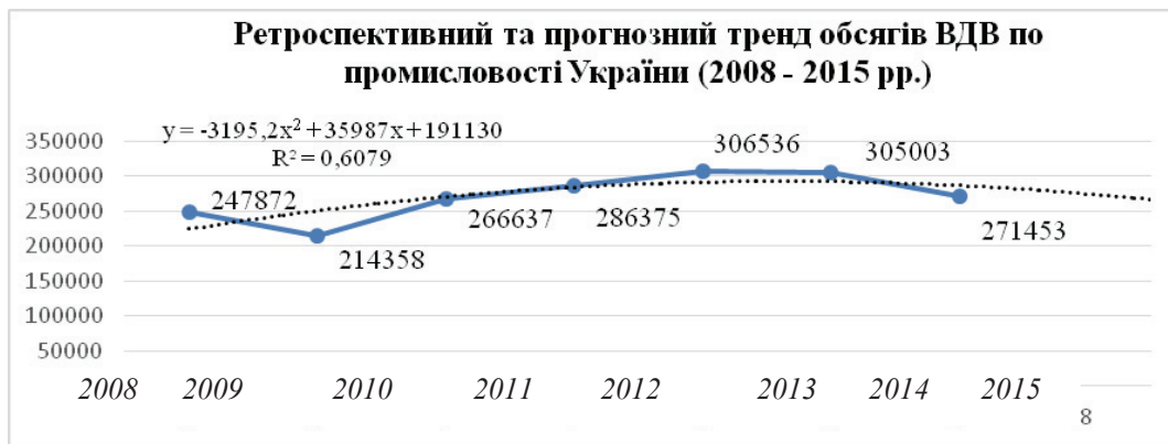
Рис. 3. Дослідно-експериментальна оцінка ретроспективних та короткострокових прогнозно-аналітичних значень обсягів ВДВ у промисловості України у ретроспективному періоді (2008 – 2015 рр.) (побудовано автором за даними [2; 6])

Поряд із цим, імовірним (на кінець 2015 р.) є падіння обсягів капітальних інвестицій (з 223,7 до 176,3 млрд. грн.), або на 45,0% (це у порівнянні зі значеннями 2013 р.). Інноваційні витрати також обумовлюють суттєві зміни – прогнозоване падіння на 16,0%.