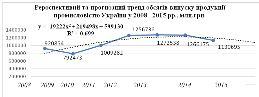
Рис. 2. Дослідно-експериментальна оцінка ретроспективних та прогнозно-аналітичних значень обсягів випуску промислової продукції в Україні у ретроспективному періоді (2008 – 2015 рр.) (побудовано автором за даними [2; 7])

Проте, більш розгорнутий і ґрунтований аналіз отриманих тенденцій дозволяє їх визнати в якості неявних або непередбачуваних трансформацій основних макроекономічних показників при поступовій схильності до істотного спаду.