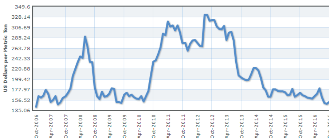
Рис. 3. Динаміка цін на кукурудзу за 2006-2016 рр. [9]

Для оптимізації системи зернового маркетингу українські сільськогосподарські підприємства можуть скористатись таким інструментом як товарна біржа. При виході на зовнішні ринки, доцільно дослідити можливості щодо розміщення пропозиції про продаж зернових на одній з товарних бірж країн ЄС, що спеціалізуються на продажі сільськогосподарської продукції (таблиця).