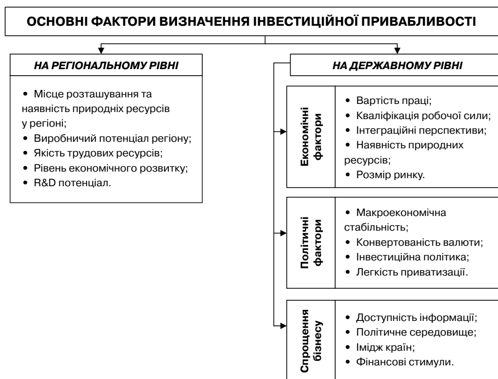
Рис. 1. Основні фактори визначення інвестиційної привабливості регіону та країни

Якщо чиста міжнародна інвестиційна позиція країни позитивна, то країна є чистим кредитором по відношенню до решти світу, а якщо вона негативна – то чистим боржником. Як ми бачимо Україна більше залучає інвестицій, ніж сама інвестує в інші економіки.