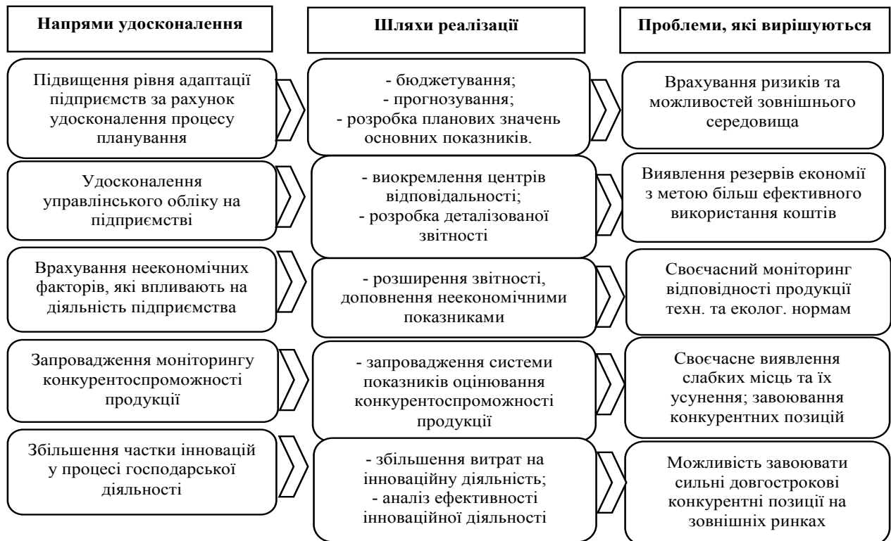
Рис. 2. Основні напрями удосконалення управлінської політики підприємства в умовах інтеграційних процесів

Аналіз основних показників діяльності підприємств України та особливостей реалізації їх управлінської політики показав, що основними проблемами, з якими стикаються українські підприємства є наступні: неготовність підприємства до настання ризиків різних видів; нехтування можливостями розвитку; недостатня увага до неекономічних чинників, які впливають на діяльність підприємства тощо (рис.2).