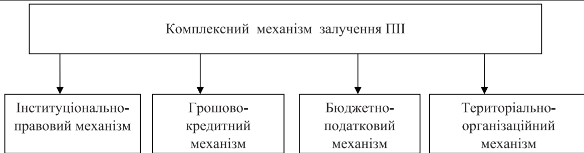
Рис. 3. Характеристика основних складових комплексного механізму залучення прямих іноземних інвестицій [2]

Інституційно-правовий механізм покликаний забезпечити формування належного правового середовища, необхідного для залучення іноземних інвестицій з урахуванням національного та світового досвіду, а також міжнародних зобов'язань України.