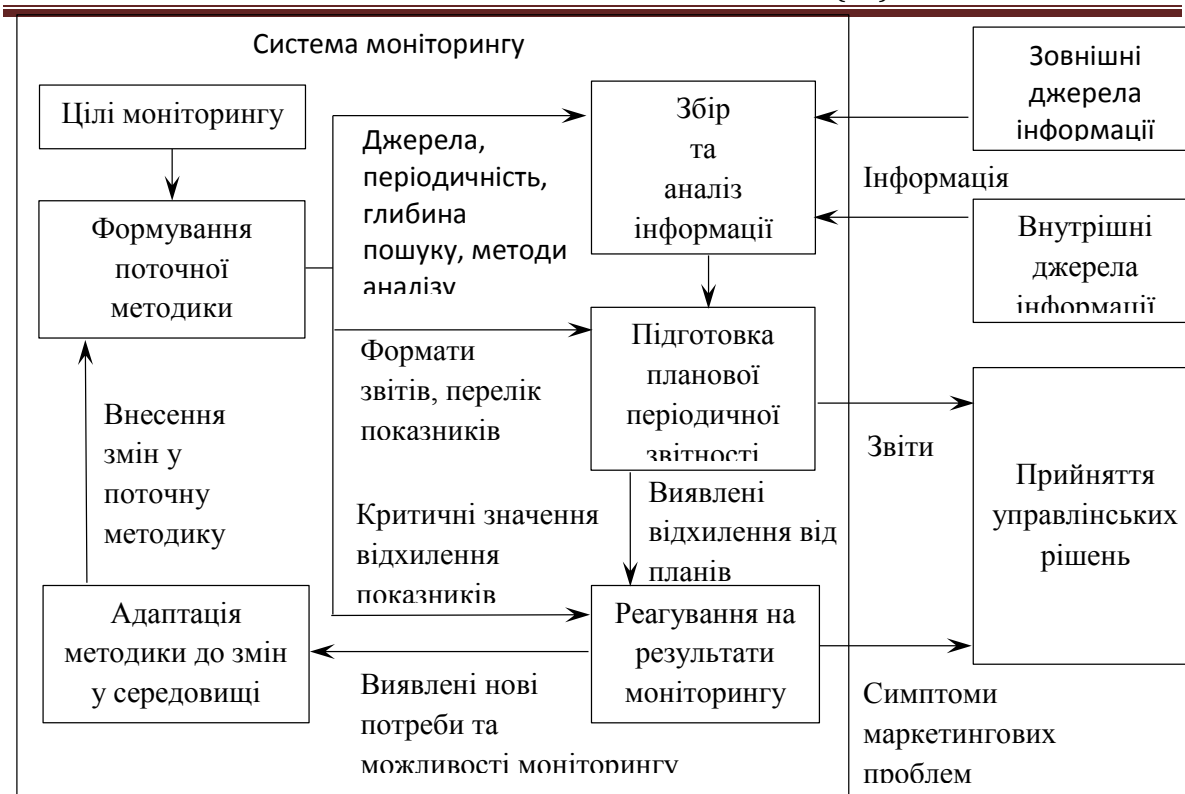
Рисунок 1 – Структурно-логічна схема функціонування системи моніторингу маркетингового середовища підприємства

Пошук даних відбувається згідно з розробленою програмою, що включає джерела інформації, які підлягають опрацюванню з певною періодичністю та визначеною глибиною аналізу. Джерела інформації можуть бути внутрішні: дані та інформація з корпоративних документів різних форматів, екстранету, пошти; та зовнішні: соціальні мережі, телебачення та відео, радіомовлення та аудіозаписи, Інтернет-сторінки (державні та корпоративні сайти, засоби масової інформації в Інтернеті, блоги, форуми). Для кожного елементу маркетингового середовища, для кожного напрямку моніторингу визначаються відповідні джерела, що детально представлені в таблиці.