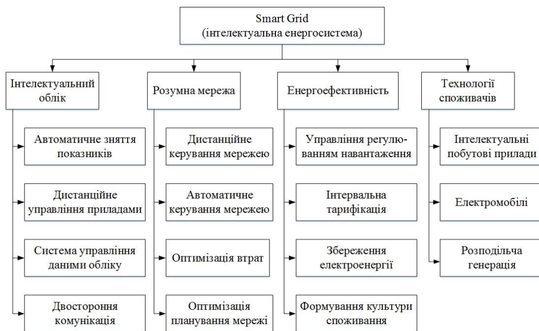
Рисунок 2 – Структура Smart grid [3]

Основна відмінність в роботі Smart grid полягає в тому, що в традиційних мережах струм по проводах потрапляє від генерації до споживача у відповідності з зарані заданим рівнем напруги і опору. Якщо ж запровадити Smart grid в енергосистему, то вони зможуть самостійно регулювати подачу електроенергії в залежності від зниження чи збільшення режиму споживання [3].