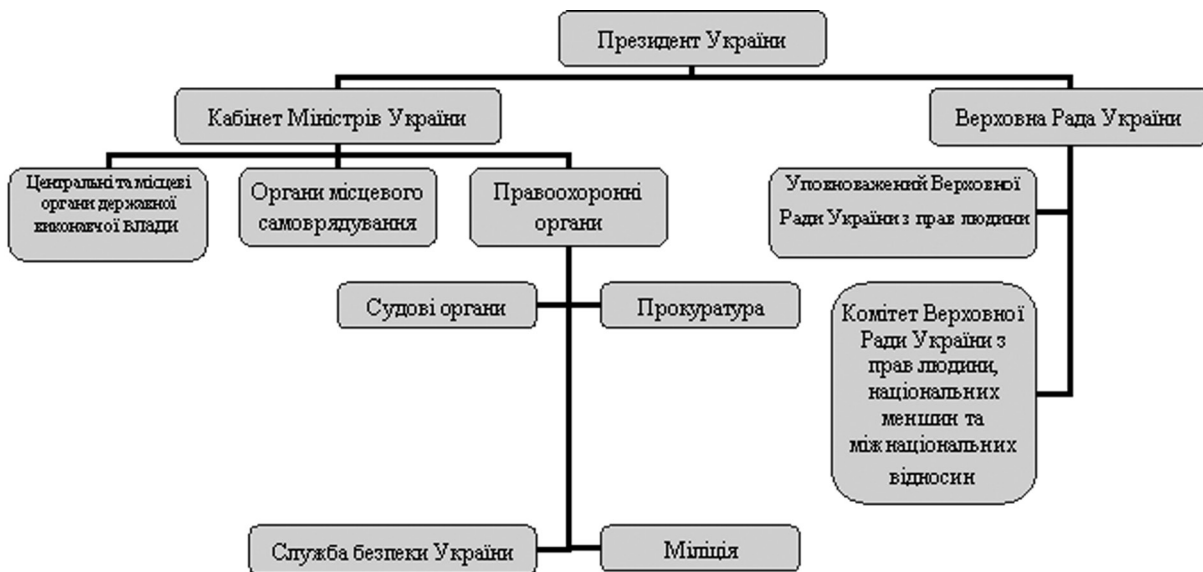
Рис. 4. Схема підпорядкованості та взаємодії державних та виконавчих органів України з питань забезпечення прав людини

Взаємодія державних та виконавчих органів влади забезпечує не тільки виконання прав людини, а також контроль за забезпеченням та захист цих прав. Схема підпорядкованості та взаємодії державних та виконавчих органів України з питань забезпечення прав людини приведена на рисунку 4. Контроль за станом забезпечення прав людини відбувається зверху вниз, а обсяги забезпечення – навпаки. Захист прав людини виконується, головним чином, правоохоронними органами.