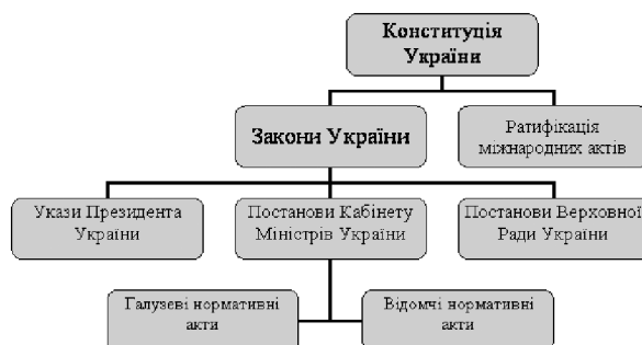
Рис. 6. Структура нормативно-правового забезпечення прав людини в Україні

Друга складова адміністративної системи забезпечення захисту прав людини в Україні, яка є її невід'ємною частиною, є нормативно-правове забезпечення. Забезпечення та захист прав людини в Україні гарантується Конституцією України. Перелік нормативно-правових актів в залежності від права встановлення складає ієрархічну схему нормативно-правового забезпечення. Структура нормативно-правового забезпечення прав людини в Україні наведена на рисунку 6.