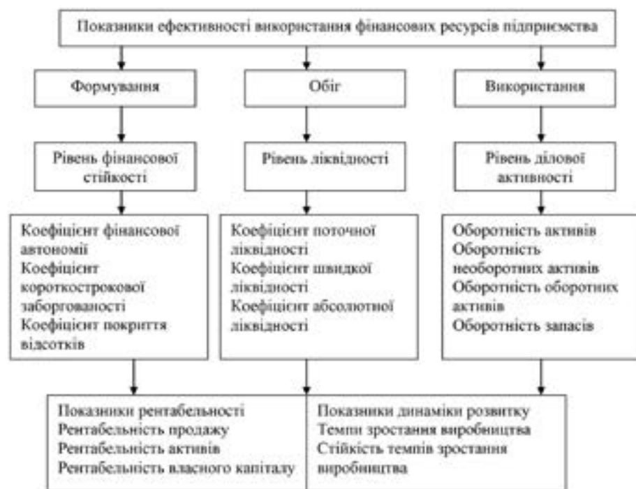
Рис. 2. Показники ефективності використання фінансових ресурсів підприємства

Таким чином, у сучасних умовах господарювання значна частина підприємств зазнає необхідності підвищення ефективності і раціоналізації процесів управління фінансовими ресурсами. В залежності від поставлених цілей розвитку діяльності підприємств будуть змінюватись і напрями використання фінансових ресурсів. Серед можливих проблемних завдань, які можна вирішити за допомогою ефективного використання фінансових ресурсів є створення конкурентоспроможної бази підприємства; забезпечення лідерства серед конкурентів; уникнення банкрутства; зростання обсягів виробництва та реалізації; покращення показників прибутковості та збільшення ринкової вартості підприємства. Результативність використання фінансових ресурсів