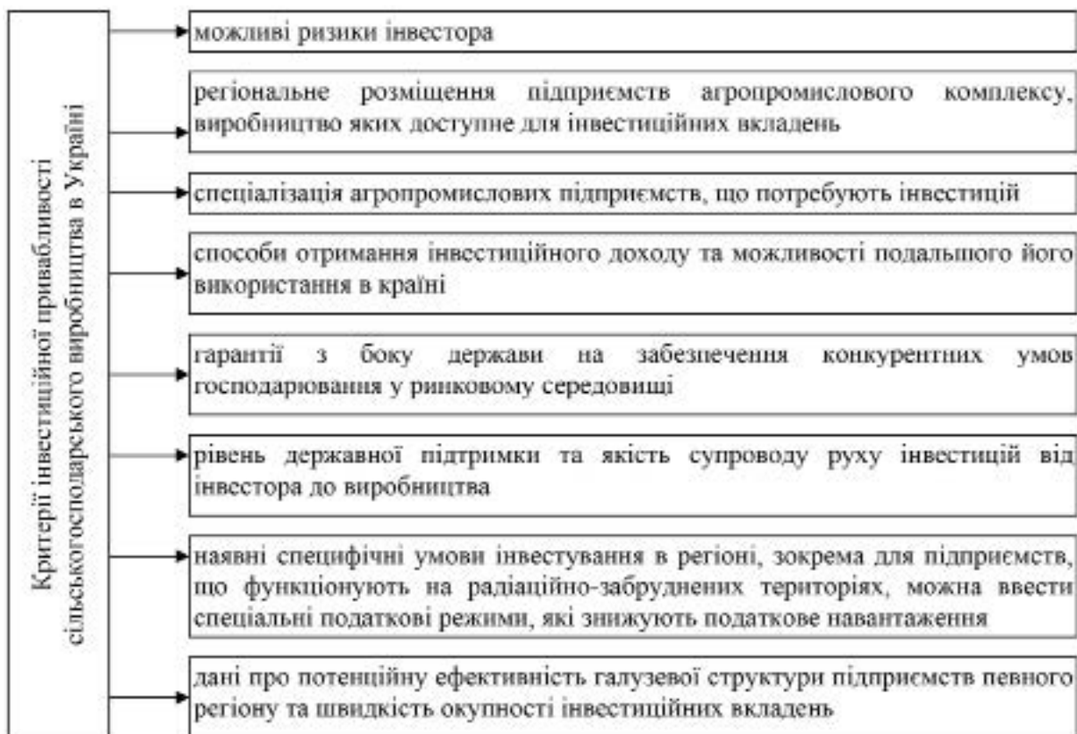
Рис. 3. Склад можливих критеріїв інвестиційної привабливості сільськогосподарського виробництва в Україні

Саме оцінюючи ці та деякі інші чинники, буде визначатись рівень інвестиційної привабливості агропромислового комплексу України для зарубіжних інвесторів. Проте, потрібно розробляти певний перелік критеріїв відповідності інвестора потребам сільського господарства, оскільки будь-яку фізичну чи юридичну особу із потенційними фінансовими вкладеннями залучати не можна. Це пов'язано з тим, що, відкриваючи доступ до українського сільського господарства шляхом залучення закордонних інвестицій, існуватиме загроза економічній безпеці підприємств через недобросовісну участь інвесторів. Тому варто оцінювати