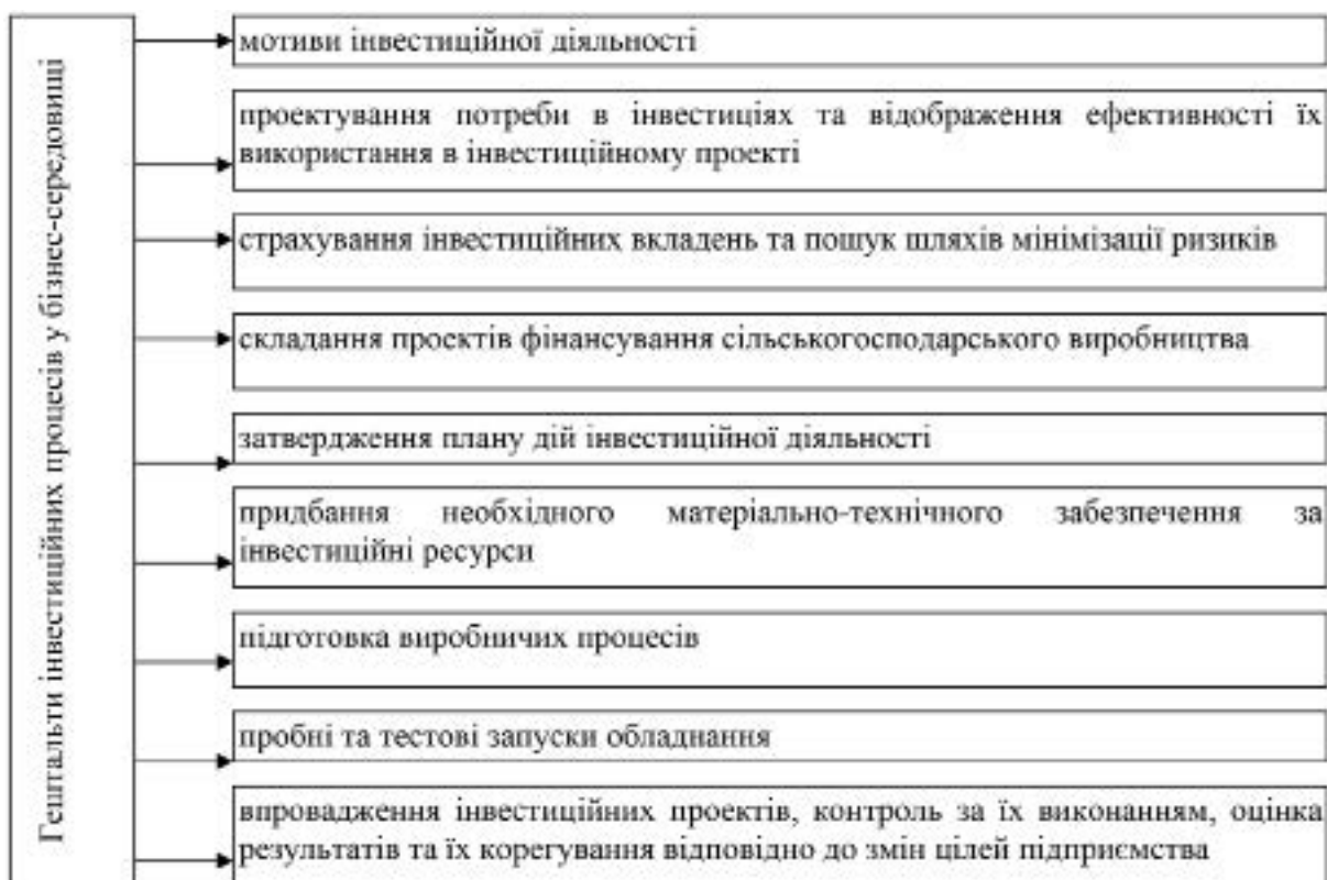
Рис. 1. Гештальти інвестиційного процесу у бізнес-середовищі