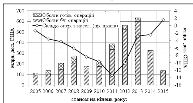
Рис. 2. Обсяги операцій із купівлі-продажу іноземної валюти на міжбанківському та внутрішньому валютних ринках України в 2005–2015 рр.

Разом із цим отримані кошти вповноважені банки все частіше спрямовували не тільки і не стільки на підтримку належного рівня регулятивного капіталу, як на підвищення власної прибутковості. Зокрема, найпростішим у період нестабільності шляхом до цього є операції з купівлі-продажу іноземної валюти один в одного та населенню (рис. 2).