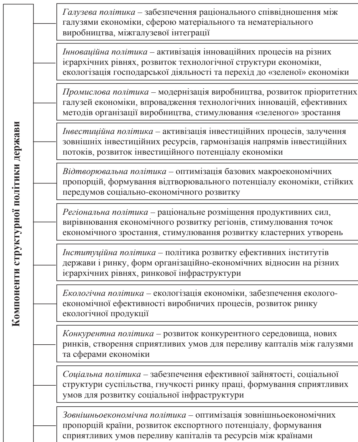
Рис. 1. Компоненти структурної політики держави [1–5; 7; 10; 11; 14–22]

Дуже часто в науковій літературі використовуються поряд із поняттям структурної політики, такі поняття, як «промислова» та «галузева політика», при цьому мають місце різні погляди на розкриття їх сутності та взаємозв'язку, що не в останню чергу пояснюється домінуючими ідеологічними концептами. Однак структурна політика є значно ширшим поняттям, вона включає в себе цілу систему складників, зокрема промислову та галузеву політику, що