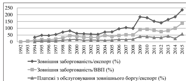
Рис. 2. Показники зовнішньої заборгованості України

На рис. 2 представлено основні показники зовнішньої заборгованості України. На основі представлених показників є підстави говорити про постійне зростання зовнішньої заборгованості в Україні, зростаюче навантаження на вітчизняну економіку від погашення та обслуговування зовнішніх боргів.