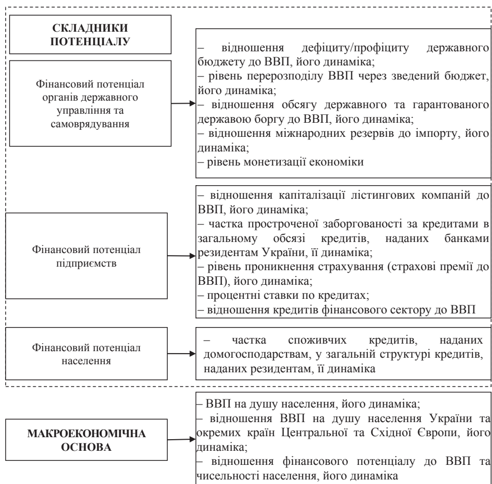
Рис. 3. Показники оцінки ефективності використання фінансового потенціалу держави

У статті було критично вивчено та визначено основні показники, необхідні для оцінки фінансового потенціалу, що були розмежовані у дві групи: показники оцінки стану та ефективності використання потенціалу, які в подальшому були деталізовані на рівні