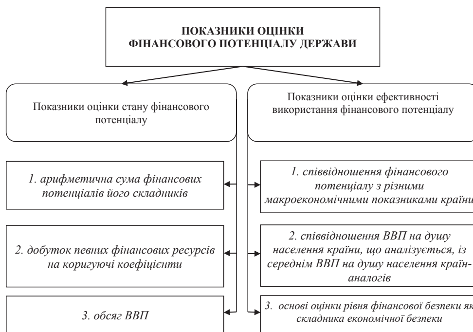
Рис. 1. Узагальнення підходів до визначення показників оцінки фінансового потенціалу держави

де FR – обсяг фінансових ресурсів, а k_1, k_2 \dots k_n – відповідні коефіцієнти.