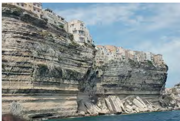
Самый колоритный городок Корсики — Бонифачо, примостившийся прямо на прибрежных скалах из белого известняка

Корсика немного напоминает Крым, если только добавить итальянских страстей, приправленных французским шармом. Смесь традиций и культур ощущается во всем: от восхитительной местной кухни до мелодичного языка, так как остров долго переходил из рук в руки, от Италии к Франции. Сейчас Корсика — один из 27 департаментов Франции с особым автономным статусом. Официальным языком является корсиканский, фонетической основой которого служат итальянские диалекты, а лексическое наполнение заимствовано из французского.