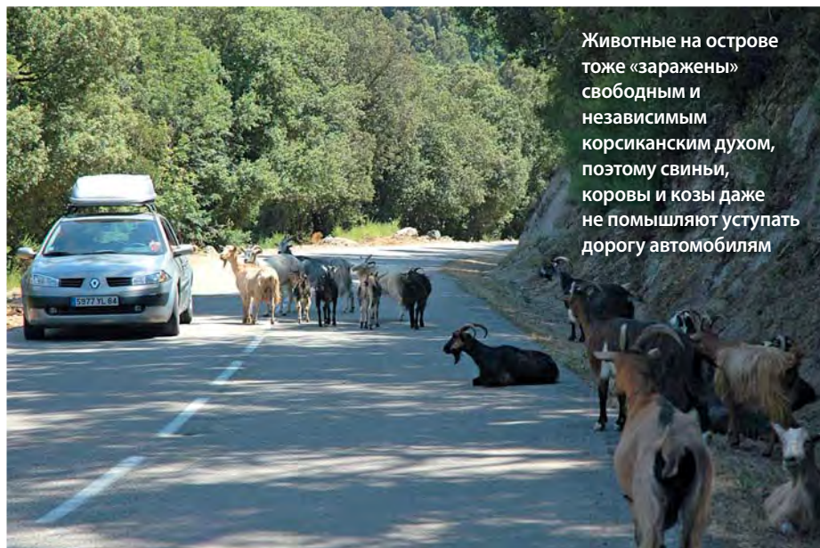
Животные на острове тоже «заражены» свободным и независимым корсиканским духом, поэтому свиньи, коровы и козы даже не помышляют уступить дорогу автомобилям