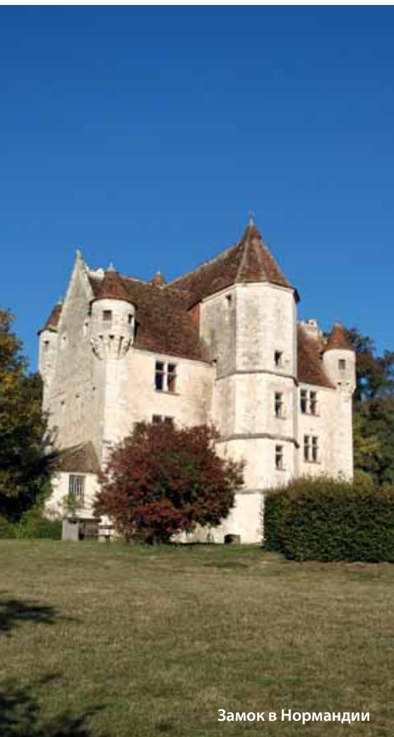
Замок в Нормандии