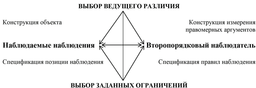
Схема 1. Аналитическая стратегия (по Н. Акерстрёму Андерсену).

Для того чтобы было наглядно ясно, что такое аналитическая стратегия, Н. Акерстрём Андерсен предлагает следующую схему (схема 1) [4, p.117]. В схеме 1 вводятся ряд понятий [4, p.117]: «ведущее различие» ( guiding distinction ), «заданные ограничения» ( conditioning ), «наблюдаемое наблюдение» ( observations observed ), «второпорядковый наблюдатель» ( the second-order observer ), «конструирование объекта» ( construction of object ), «конструирование измерения правомерных аргументов» ( construction of measures for valid arguments ), «спецификация позиции наблюдения» ( specification of point of observation ) и «спецификация правил наблюдения» ( specification of rules of observation ).