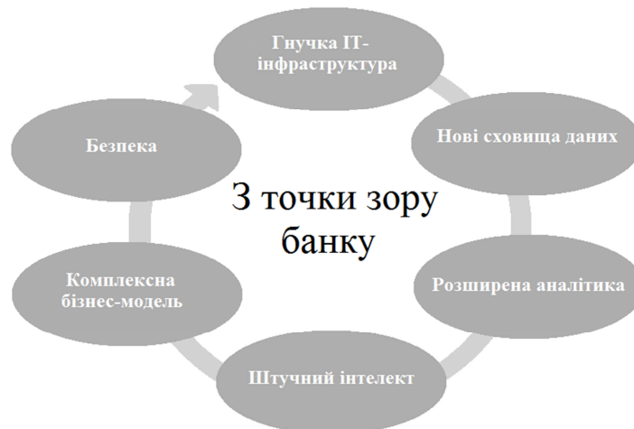
Рис. 4. Ключові вимоги до банків з погляду самого банку

- Підтримка СМБ. Нові кредитні моделі для малого і середнього бізнесу дозволять збільшити прибутковість від обслуговування таких компаній.