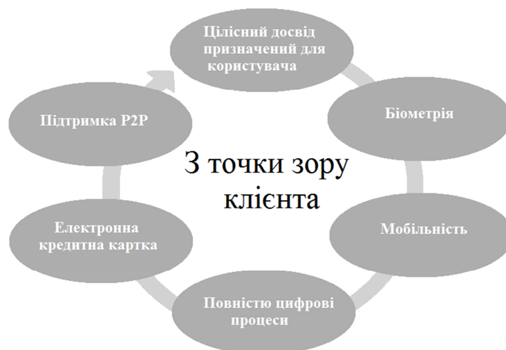
Рис. 2. Ключові вимоги до банків з погляду клієнта

Ключові вимоги до банків розглядають з трьох поглядів: споживача (рис. 2), інвестора (рис. 3) і самого банку (рис. 4).