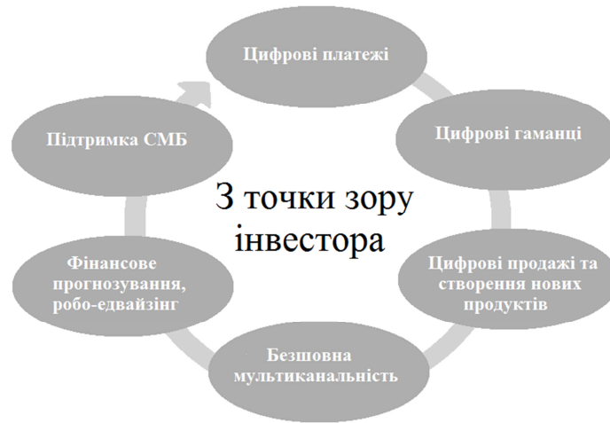
Рис. 3. Ключові вимоги до банків з погляду інвестора

- Підтримка P2P-перекладів і краудфандінга, включаючи P2P-кредитування.